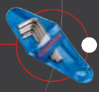
● ALLEN KEYS